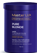
PURE BLONDE ЧИСТИЙ БЛОНД