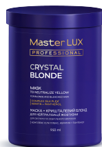
CRYSTAL BLONDE КРИСТАЛЕВИЙ БЛОНД